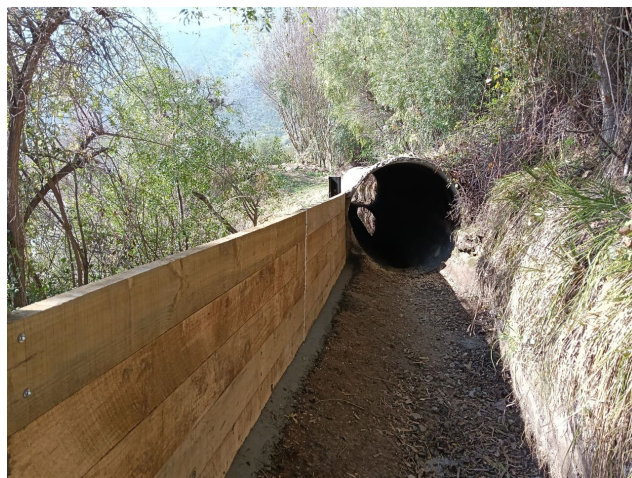
Reparación de Muro Tablones Impregnados Canal Peumal Sector Butron