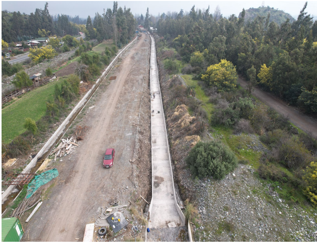
Revestimiento Canal Apaltas