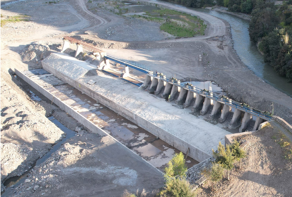
Trabajos Segunda Etapa Proyecto – 10 Octubre 2025