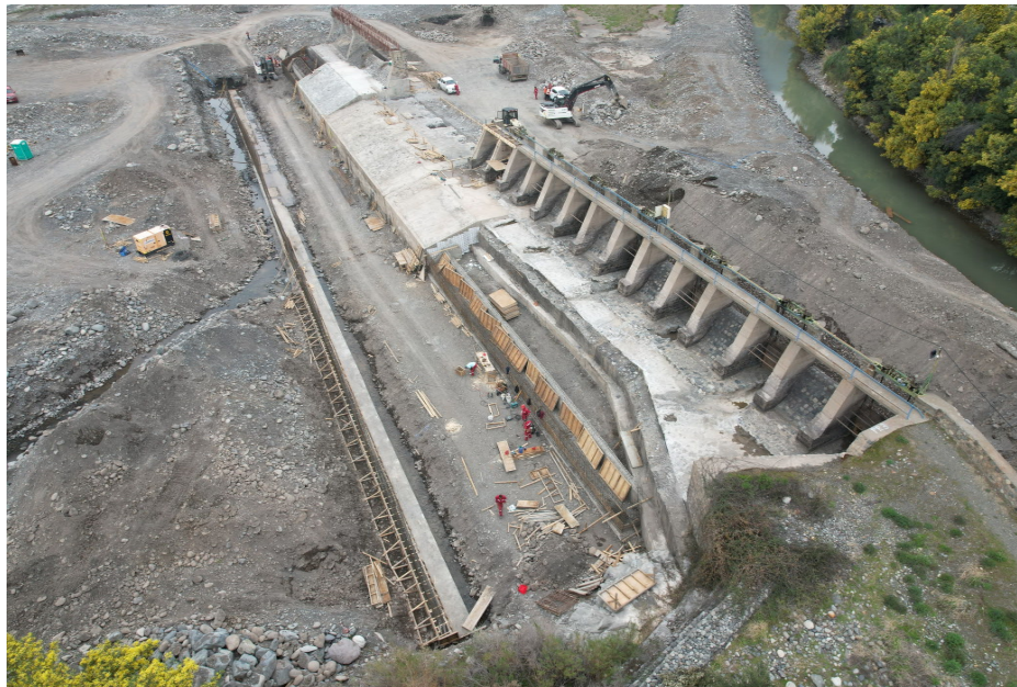
Trabajos Segunda Etapa Proyecto – 12 Agosto 2025

Conforme a lo aprobado en la Junta General Ordinaria de Accionistas celebrada el 24 de abril de 2025, el bono fue endosado al Banco Estado, permitiendo así asegurar el financiamiento necesario para la ejecución de las obras civiles contempladas en el proyecto.