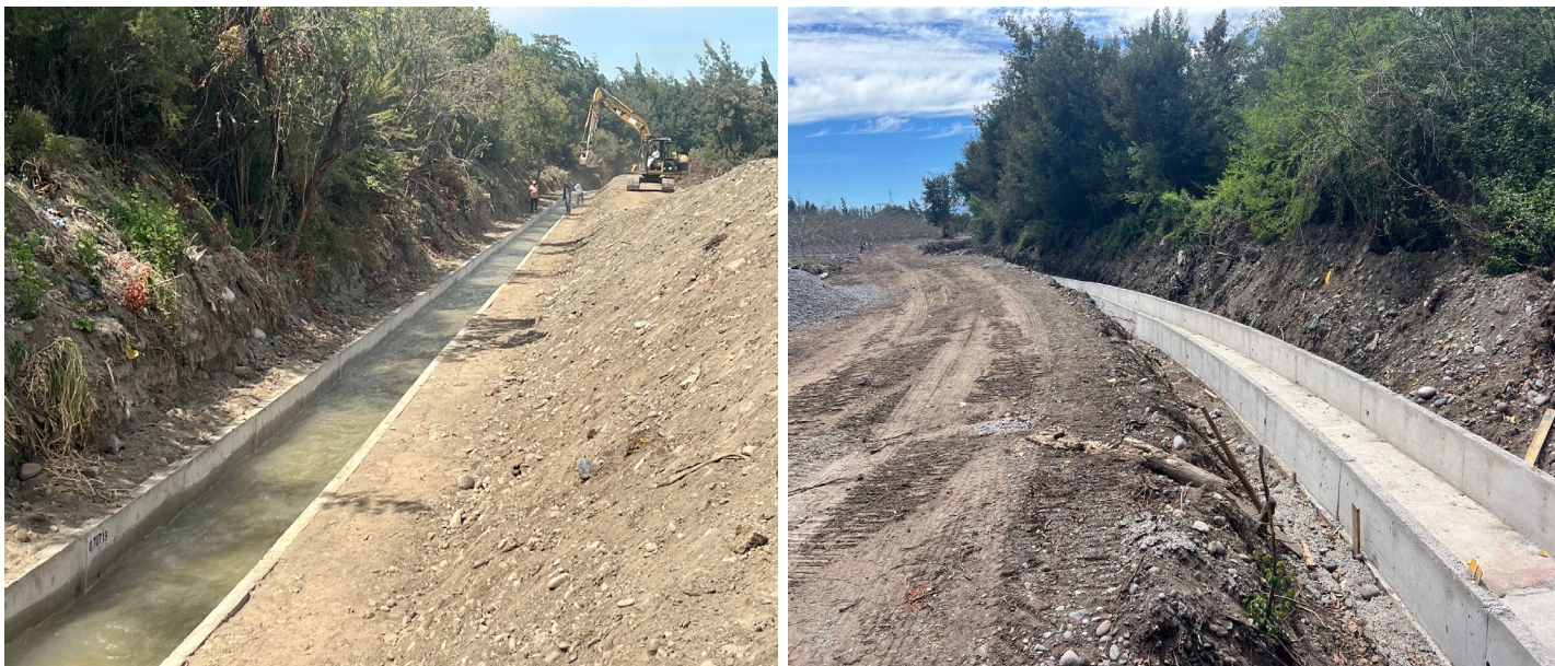
Revestimiento Canal Crianza

El mejoramiento continuo de la base de datos de la Asociación, junto con el trabajo coordinado con los consultores, ha permitido postular cada año a un mayor número de proyectos, lo que se refleja favorablemente en la obtención de bonificaciones, en beneficio directo del sistema de riego y de los señores asociados.