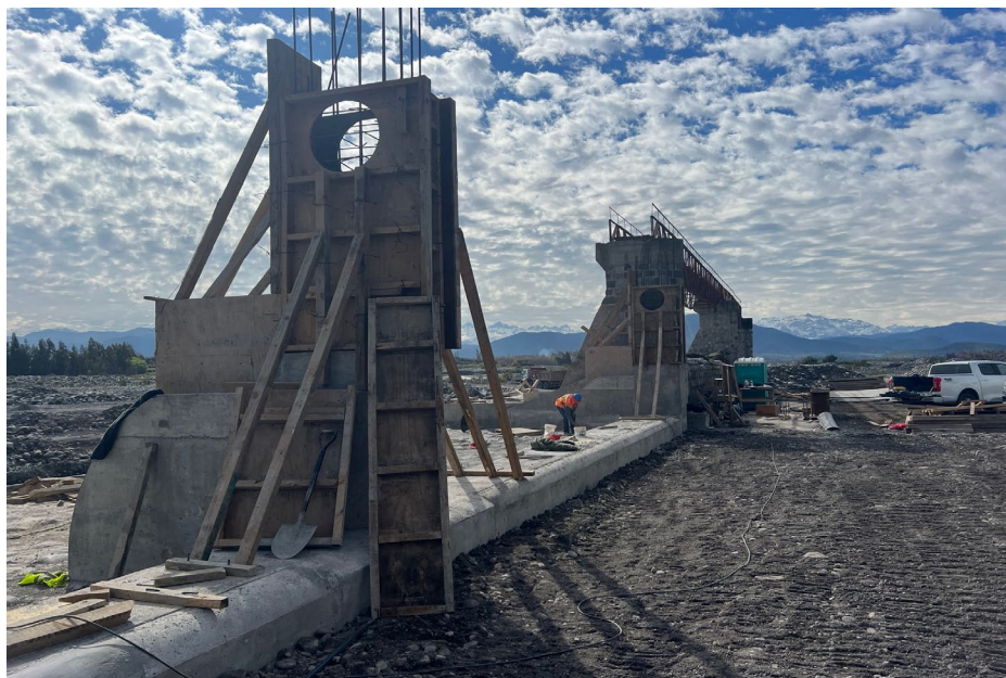
Trabajos Segunda Etapa Proyecto – 23 Septiembre 2025