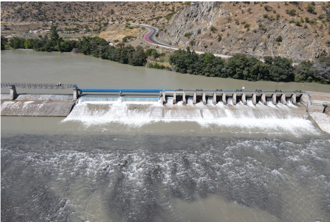
Recepción del Proyecto – 23 Octubre 2025