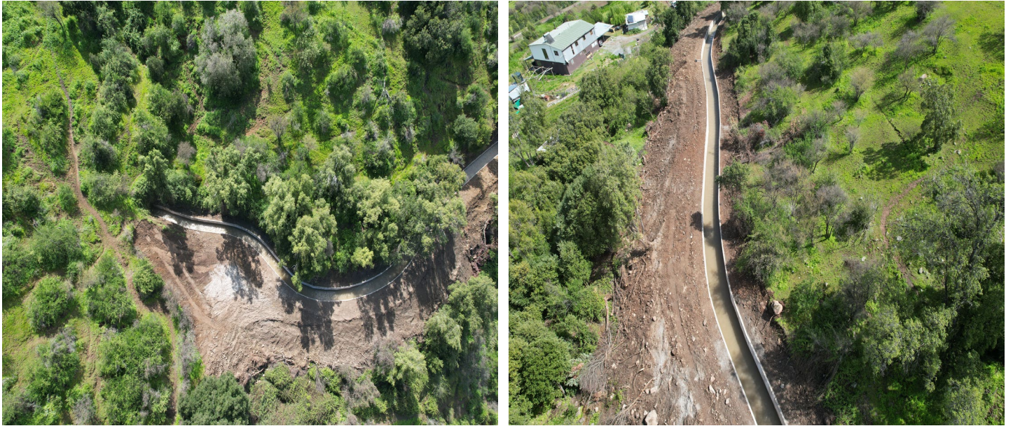
Revestimiento Canal Peumal