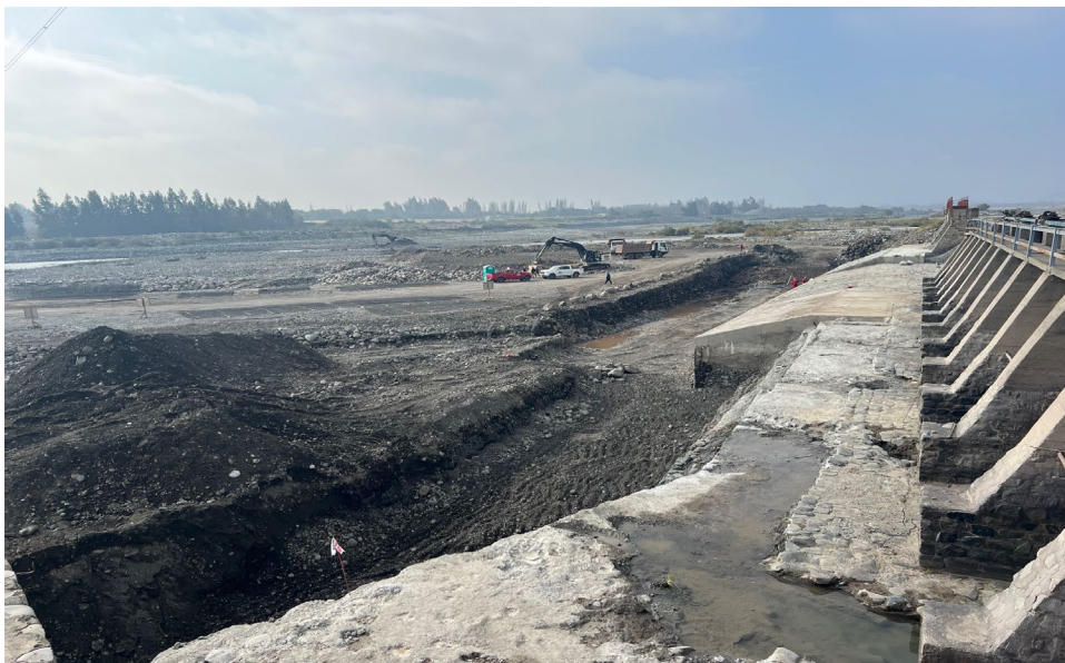
Trabajos Iniciales Segunda Etapa Proyecto – 14 Julio 2025

Con fecha 25 de junio de 2025, la Comisión Nacional de Riego otorgó la bonificación más alta entregada en su historia, por un monto de UF 32.412,91 , beneficio que fue adjudicado a nuestra Asociación para el proyecto de Reconstrucción de la Bocatoma de la Ribera Sur del río Cachapoal . La obtención de este bono resultaba fundamental para dar continuidad y término a las obras iniciadas durante el año 2024.