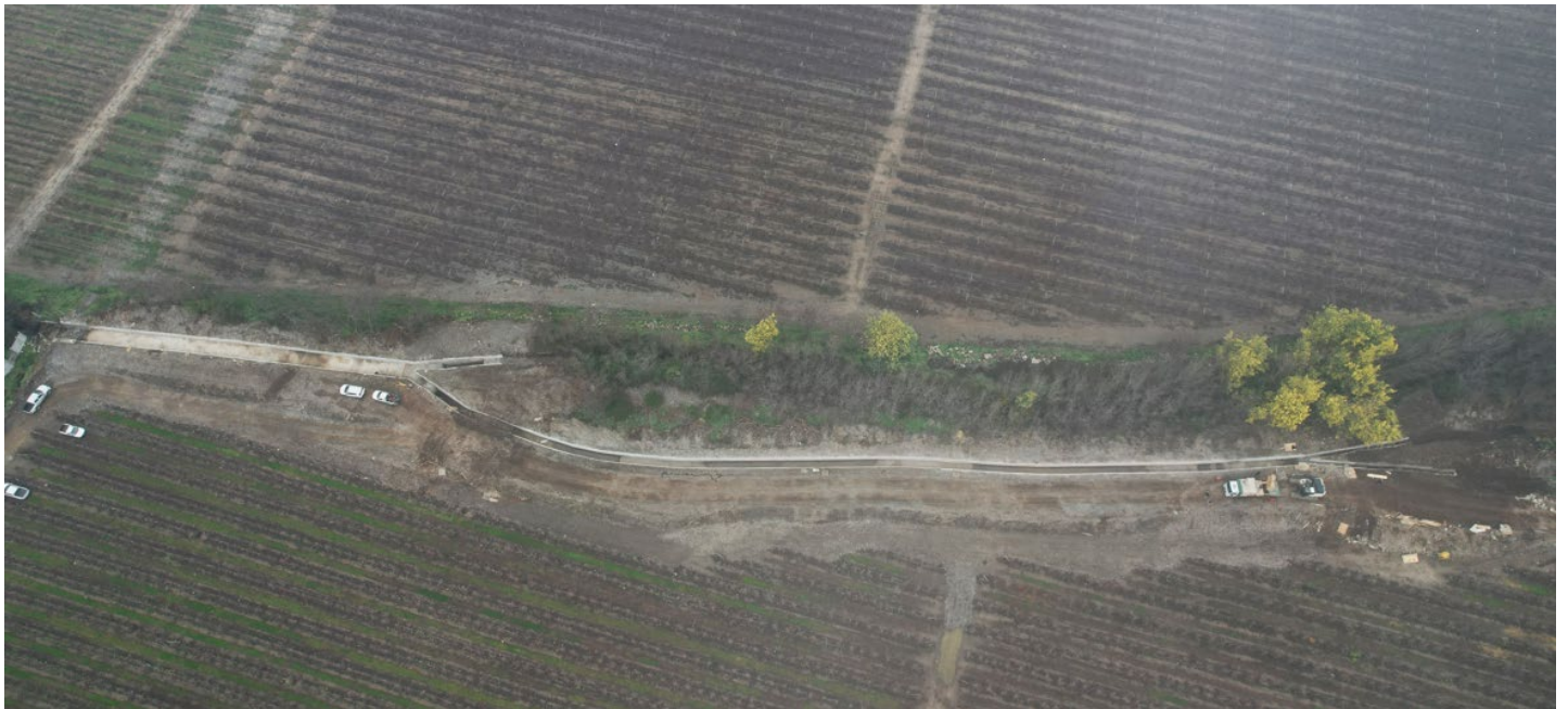
Revestimiento Canal Comunidad