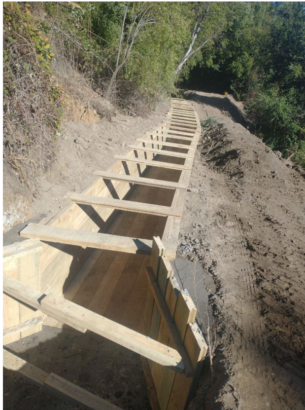
Construcción de Canal en Tablones Impregnados Canal Peumal Sector Francisco Lecaros